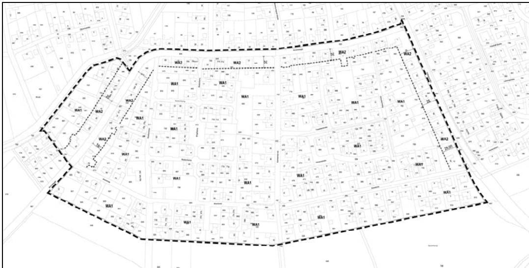
Abbildung 2: Bebauungsplan (Planzeichnung, unmaßstäblich)

Der Bebauungsplan ist als Anlage 3 beigefügt.