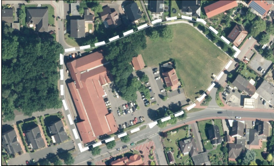
Abbildung 4: Lageplan Dorfplatz Alstätte (unmaßstäblich)