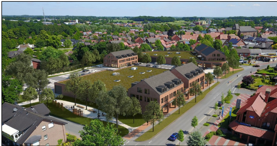
Abbildung 2: Städtebauliches Umnutzungskonzept Dorfplatz Alstätte Schrägansicht Blickrichtung Dorfkern (Stand: 13.07.2017)