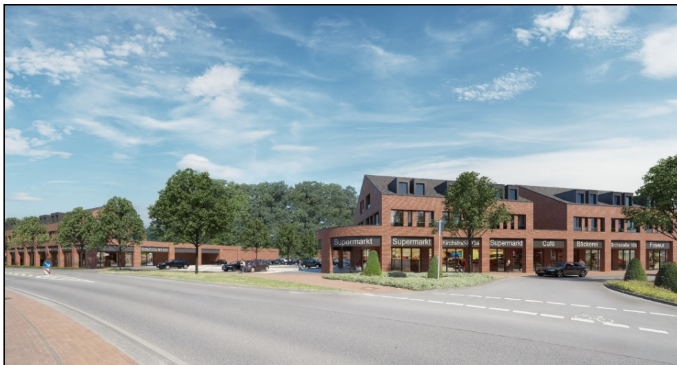
Abbildung 3: Städtebauliches Umnutzungskonzept Dorfplatz Alstätte Ansicht Haaksbergener Straße / Einmündung Kirchstraße (Stand: 13.07.2017)