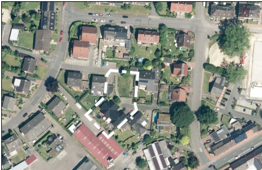
Abbildung 1: Luftbild (unmaßstäblich)

Das Plangebiet (siehe Abbildung 1) liegt am Ende einer zur Heuss Straße gehörenden Stichstraße.