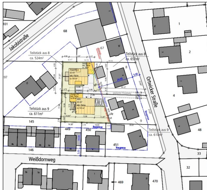
Abbildung 2: Von den Antragstellern favorisierte Planung

Die nachfolgende, von den Antragstellern favorisierte Planung zur städtebaulichen Nachverdichtung der Grundstücke Ortwickler Straße 4 und 6 wurde gebilligt. 1