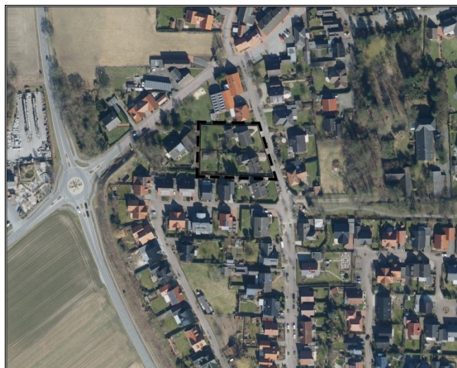
Abbildung 1: Lageplan (unmaßstäblich)